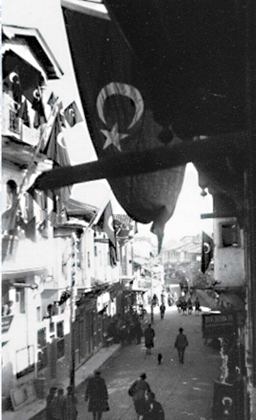
1930 Cumhuriyet Caddesi